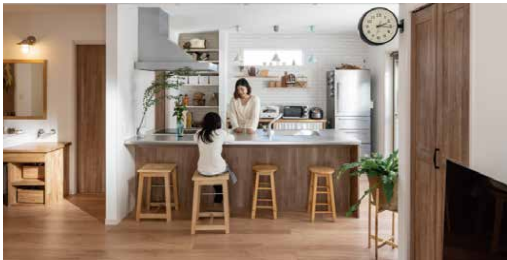
掲載の写真はクィーンズホームが建築したものです